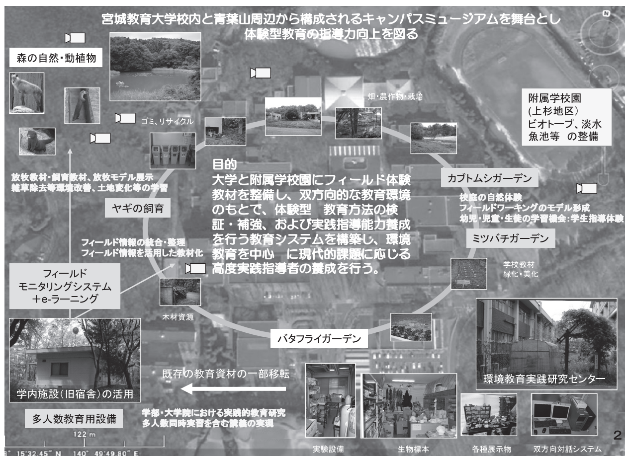
図2. リフレッシュ教育システムの構想 (青葉山キャンパス)

実習者の専門性と経験度が一律で無いこと、実習者によって、体験型教育の力量形成に関わる見直し・補強の質と程度が異なること、さらに、講義によって教材園を利用する目的が異なるためである。このために、多目的利用を想定したシステム整備が必要となる。担当教員が予め課題や実習に必要な情報をシステムに登録し、それを実習者が参照しながら自分の体験レベルに合った実習を行う。例えば、環境教育や生活科などの授業では、数十名の受講者がそれぞれモバイル端末を持って教材園に分散し、登録情報を参照しながら実習を行う。