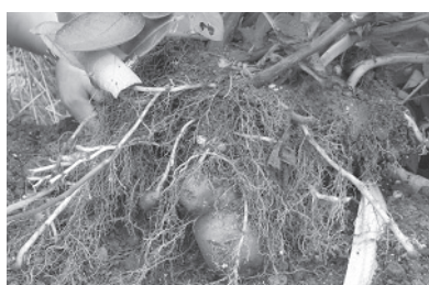
図2. 袋栽培のジャガイモ（皮が赤い品種：アンデス）を用いた地下部の観察