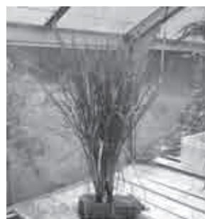
図5. ペットボトルイネの栽培