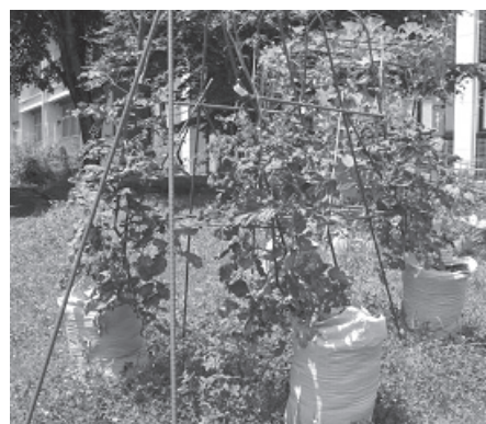
図3. 支柱を立てたミニトマトの袋栽培

袋に入れる土は、粒子間に間隔のある柔らかな土を選び、粘土質土壌の場合はパーミキュライトなどを混ぜ込んで改良することが必要である。