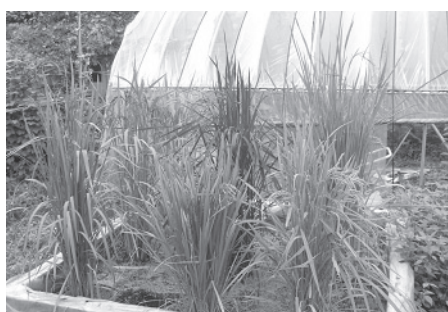
図4. 教材としてのバケツイネの実践 上図：バケツを用いた多様なイネ品種の栽培 中図：学生によるバケツイネの観察 下図：水温を安定させるための工夫

ケツイネを簡易プールに浸け、水温を安定させる方策をとっている（図4下図）。これは、栽培管理上、頻繁な灌水の手間を減らす工夫ともなる。