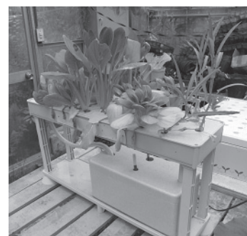
図6. 市販水耕装置（ハイポニカ 501 型）