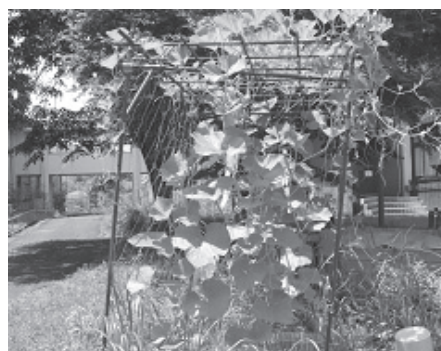
図8. 波板栽培容器によるヒョウタンの栽培