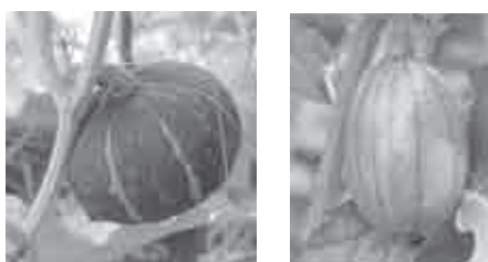
図9. アーチ仕立て栽培による果菜類の栽培 上図：カボチャ 中図：スイカとメロン 下図：肥大途中の収穫物（カボチャとスイカ）