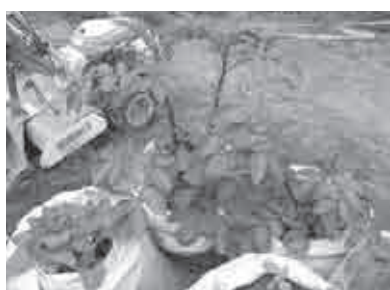
図1. サツマイモ（左）とジャガイモ（右）の袋栽培

この他、数種類の教材植物を栽培したが、経験則として注意すべきいくつかのポイントを見いだした。ひとつは、袋の表面から水がしみ出すので、プラスチック製プランターなどよりも土が乾きやすく、頻繁な灌水が必要であった。これは、袋の材質を選ぶことにより、多少改善される可能性もある。もうひとつは、袋に入れた土が常に袋の圧力を受けているため、根の伸長に悪影響を及ぼすほど土が固く締まることがある。