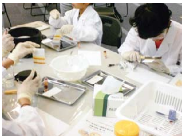
図 3 展開した薄層プレートよりリコペンの赤色に着色したシリカゲルを削り取る