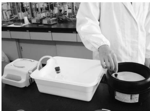
図5 簡易エバポレーター