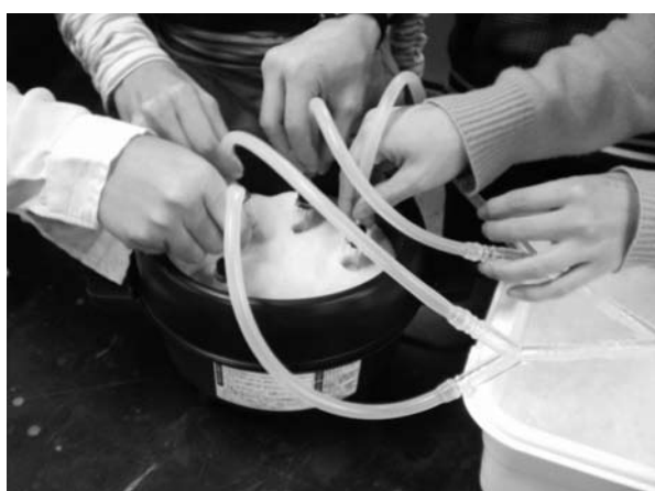
図6 4つのサンプルびんの溶液を同時に濃縮できる

溶液を入れる容器を加熱する器具としては、家庭用調理器具ミニグリル鍋（TWINBIRD、EP-4164）に海砂（Wako, 425~850 \mu m）を入れた砂浴を使用した（図5）。加熱側は分岐のコネクターとゴム管、ゴム栓などを適宜組み合わせ、同時に複数の容器から溶媒を蒸発できるようにした（図6）。