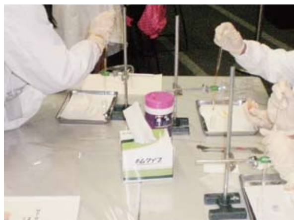
図 4 シリカゲルを濾過により除去して純リコペン溶液を得る