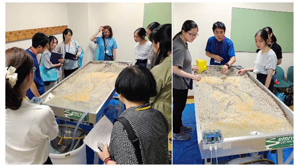
図3. 実験の様様. 本実習の生徒と担当者以外の関係者も足を止め観察していた.