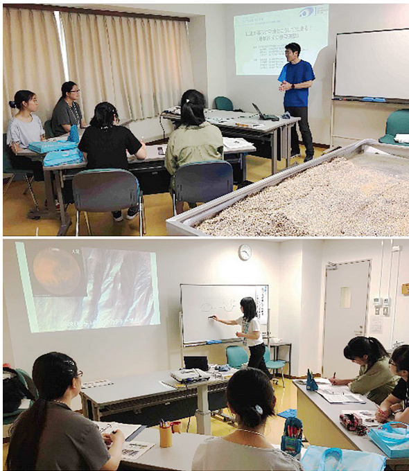
図2. 実験実習の導入の様様