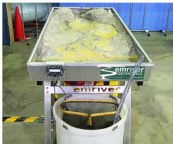
図1. Little River Research & Design社製Emriver Em2 (写真は寒地土木研究所所有の機材)

今回の実験実習に用いた機材は米国Little River Research & Design社製のEmriver Em2である(図1)。同社のEmriverシリーズはこれまでも地球科学分野の文献等で紹介されてきたが(例えば, 七山 2015), Em2はシリーズの中でも汎用版であり, 長さ196 cm, 幅83 cm, 深さ13 cm, 重量17.5 kgの強化アルミニウム製の薄い箱(実験台)にプラスチック(熱硬化性樹脂)粒子を敷き詰め, その実験台を高低2台の固定式立脚に乗せて勾配おおよそ8°に傾け, 約100 L 容量のパケツに貯めた水を流量可変式の電動小型ポンプで回して流し(従って実験には電源が必要), 河床に模した粒子層表面の形態変化や粒子の流れ方(侵食・運搬)・溜まり方(堆積)などを観察する機材である。水の流量と時間はコントローラーにプログラムとして設定することができ, 手動でも操作できる。また, 傾けた実験台下方の排水口は高さ可変式で, 海水準などを想定して水面高を変えることが出来る。プラスチック粒子( 1.55 \text{ g/cm}^3 )は4種の粒径から成り, 色分けされ(1.4 mm, 1.0 mm, 0.7 mm, 0.4 mm; この順に黄, 白, 茶, 赤), 特定の割合に配合されており, 粒子の大きさと侵食・運搬・堆積の関係を良く観察することが出来る。但し, 流す粒子の量を機材が調節することは出来ず, またタイプEm2には傾斜を簡便に調整する機能は付いておらず, 実験者がそれぞれ工夫して調整する。実験機材は組立て式で, ワゴン車などで持ち運びが可能である。