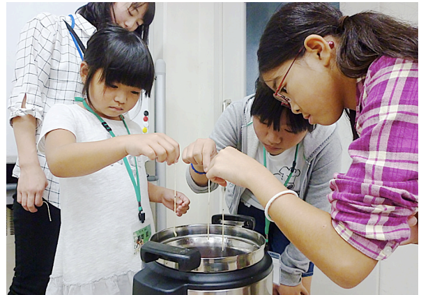
図12. スティックキャンドルづくり