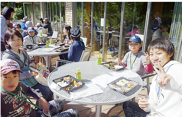
図9. 食事をしながら児童と学生との交流