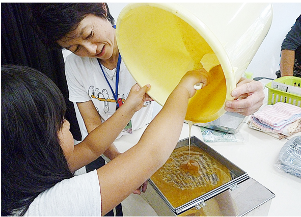
図10. ハチミツを濾過する