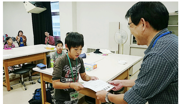
図18. 未来博士号の授与