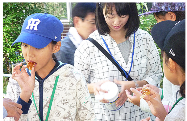
図8. 採れたたのハチミツを巣ごと味わう