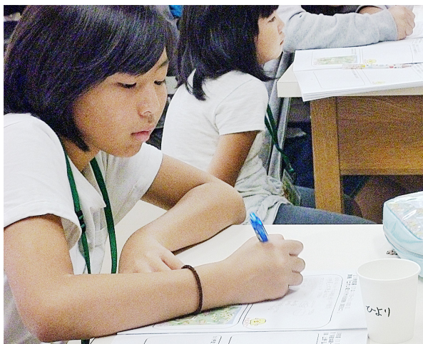
図5. 講義内容を熱心にメモする児童たち

蜂」。対馬の伝統養蜂について現地フィールド調査の成果をもとに解説した(図4)。参加者はメモをとりながら、熱心に話に耳を傾けてくれた(図5)。