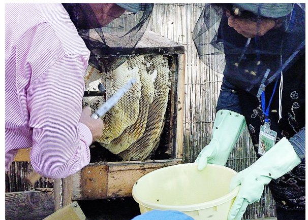
図6. 養蜂名人による歳蜜の実演