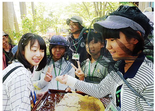
図7. 初めての採蜜体験に大はしゃぎの参加者たち