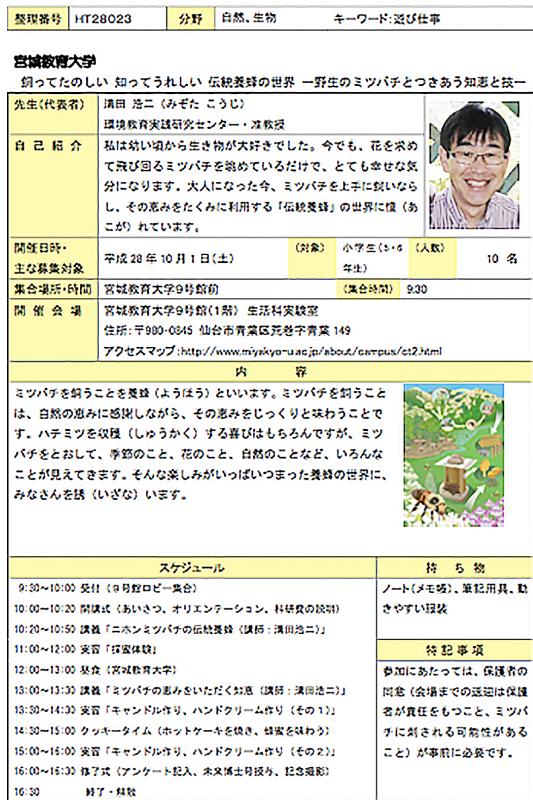
図1. 日本学術振興会ホームページに掲載されたプログラムの概要(一部)

ニホンミツバチと直接的に触れあう機会を提供する内容であることから、安全面の確保という意味合いもあって少人数(10名)を募集することにした。平成28年6月に日本学術振興会ホームページが公開されるやいやな募集定員を超える11名からの参加申し込みがあり、早々に受付を打ち切ることになった。