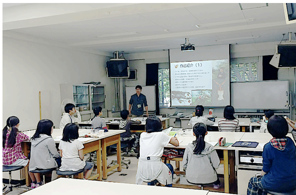
図4. 講義「ニホンミツバチの伝統養蜂」