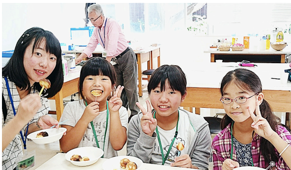
図17. ホットケーキにハチミツをつけて味わう