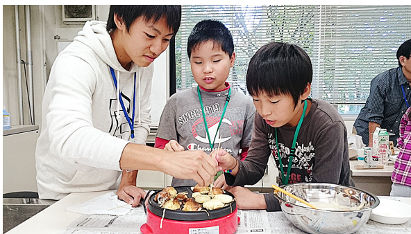
図16. たこ焼き器で丸いホットケーキをつくる