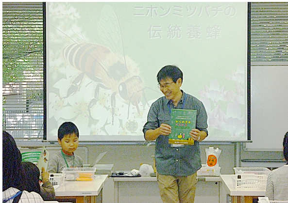
図3. 「ひらめき☆ときめきサイエンス」のパンフレットをもとに 科研費の解説を行った。