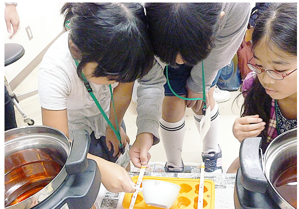
図13. ブロックキャンドルづくり