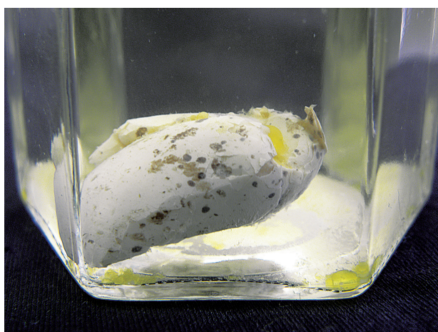
図3. 液浸標本にした卵