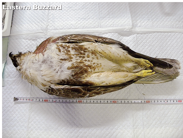
図6. 解凍後のノスリ