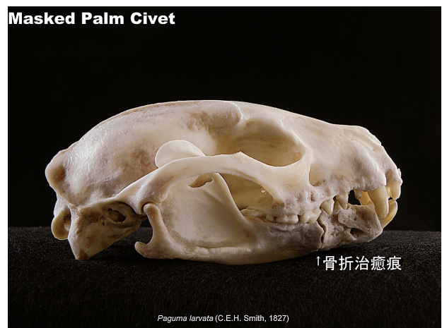
図10. ハクビシン(右側面観)