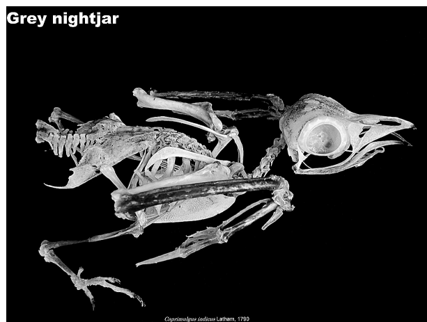
図4. ヨタカ全身骨格標本(右側面観)