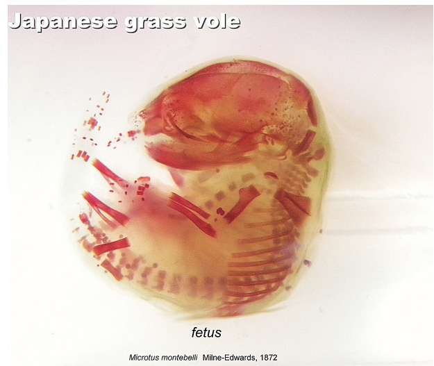
図9. ハタネズミ胎児の骨格