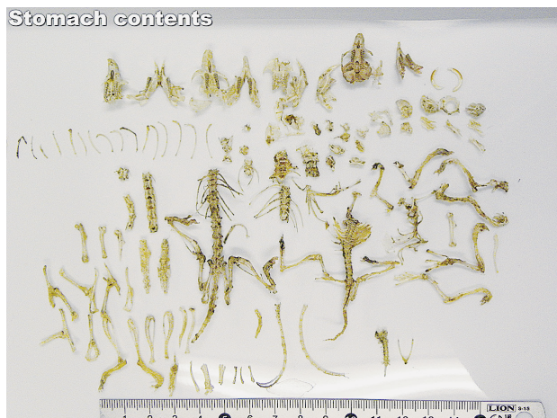
図7. ノスリの未消化物