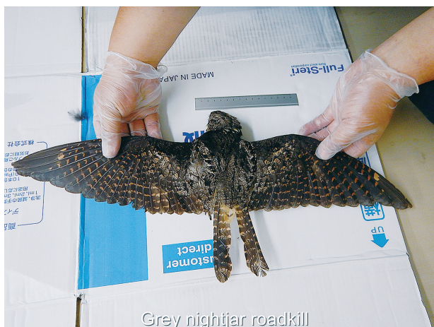
図1. 回収直後のヨタカ