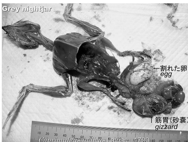
図2. ヨタカ体内の卵と筋胃