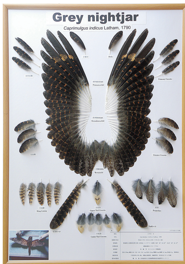
図5. ヨタカ(メス)の羽標本完成図