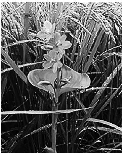
図6. 農薬不使用の遠藤環境農園の田圃に自生したミズアオイ ( Monochoria korsakowii ) .