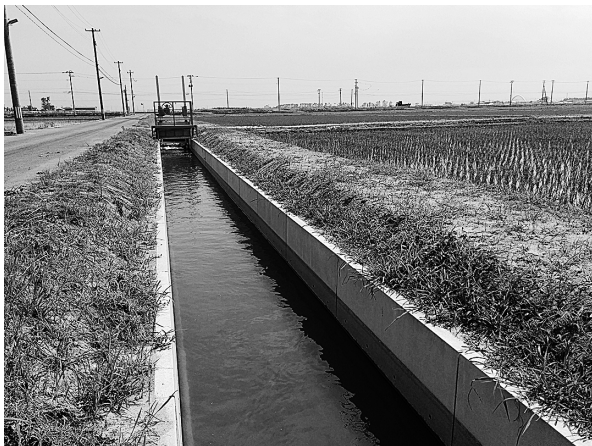
図3. 宮城県若林区井土地区の田圃周辺に震災後に敷設されたコンクリート製のU字溝水路。