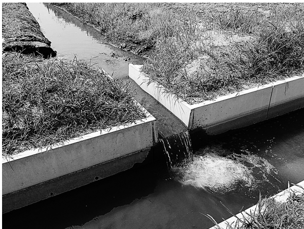
図4. 宮城県仙台市若林区井土地区周辺に震災後に敷設されたコンクリート製のU字溝水路とその支線。両水路間には落差が形成されている。