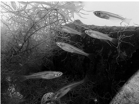
図1. 井土地区で採集されたメダカの飼育個体。

一方、本活動の最終目標は、元の生息地である井土地区周辺にメダカの野生個体群を復元することである。本来、復元ということであれば、元の生息地である井土地区の田圃やこれらに接続する用水路にメダカの生息環境を整えることが目的となるが、既に報告しているとおり、元のメダカの生息地である井土地区の田圃地帯では用水路の敷設工事や田圃の整備が完全には終わっていない。そこで本活動では、井土地区から直線距離で約5 km離れた岡田地区にある、既に除塩や圃場整備が行われて稲作が再開された田圃を用いて、本メダカ個体群再建に向けた基礎的知見を得るための試験放流を行った。なお現在、日本のメダカはキタノメダカ ( Oryzias sakaizumii ) とミナミメダカ ( Oryzias latipes ) に分類されるが (Asai et al. , 2011)、本論文ではミナミメダカのみを扱うので、論文中でメダカとした場合、ミナミメダカを指すこととする。