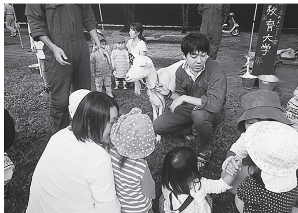
写真3. ふれあい参加者(幼児と保護者)

近づいてきた。子どもが餌をあげるところを写真にとった後で、初めて自分自身もふれあいに参加するという親が多かった（写真3）。