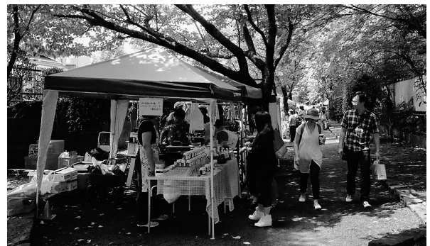
写真1. 新寺こみち市

「新寺こみち市」（写真1）は、仙台市若林区の「区民協働まちづくり事業」として、2013年から、仙台市若林区の「新寺小道緑道」で実施されるようになったいわゆる手作り市である。