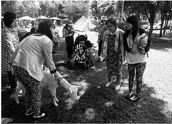
写真5. ふれあい参加者(成人)