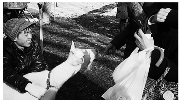
写真6. ふれあい支援時の学生の姿勢

学生には、自分たちにしか果たすことのできない役割がある。そのことに誇りを持ちながらも、逆に責任があることを理解する必要がある。「新寺こみち市」では、2年生以上の学生は、長い期間ヤギの飼育や教育実践に携わっているためヤギの取り扱いや触れ合いには慣れた様子であり、参加者からは「学生が素晴らしい」という評価を頂くことも少なくない。目線をヤギに近づけて低い姿勢でヤギの取り扱いをしている学生（写真6）は、特に好感を与えている印象である。1年生の学生は、最初の回は寒いとポケットに手をつこんだままお客さんと話をする、お客さんが来てもぼうっと見ている、などのことがあるが、回を重ねると確実に役割を理解するようになり、総体としては、天候に関わらず、協力し合いながら笑顔でふれあいを支援することができるようになった。このような