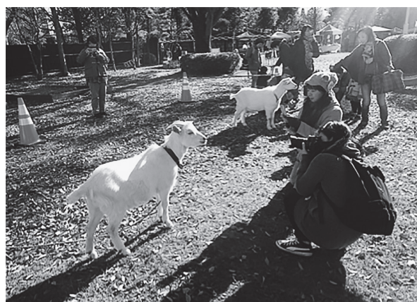
写真4. ふれあい参加者(若年層)

10～20代の参加者は、同伴者と会話しながら、写真を撮ることをきっかけに少しずつ近づいてくることが多かった（写真4）。