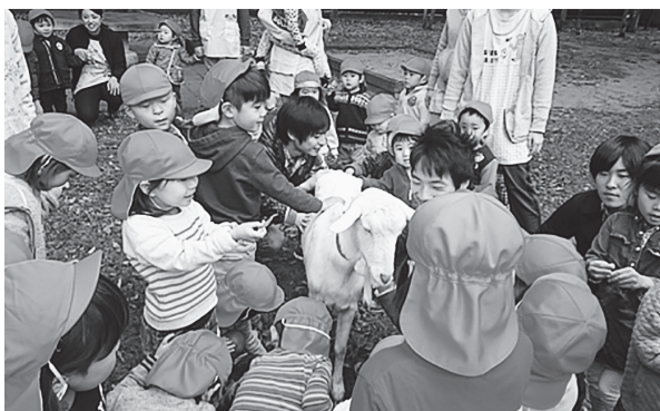
写真2. ふれあい参加者(保育所)

午前中は、複数箇所の保育所から、散歩でヤギに会いに来る子どもたちが多く、その数も次第に増えて、2014年度の後半になると、午前中、子どもたちがひっきりなしにヤギを取り囲むこともあった。餌を購入することはできないので、チモシー（通常の主食としてある牧草）などを、状況に応じて子どもたちがあげられるようにした（写真2）。