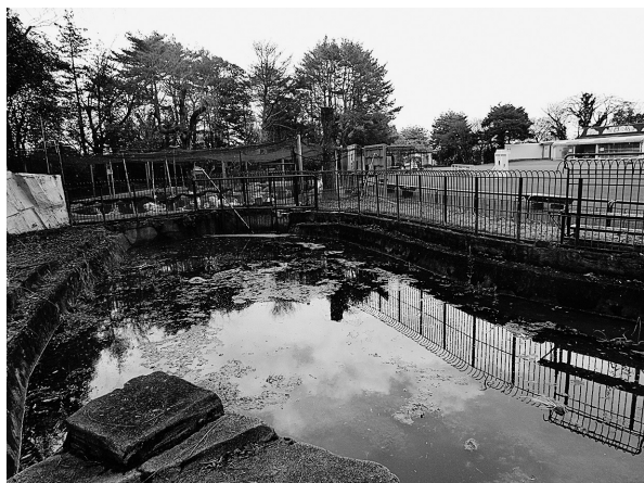
図7. 仙台市八木山動物公園に設置予定の屋外メダカビオトープ施設。

35 cm) のビオトープ池を開設予定である 1) (図7)。 この池が稼働することにより、動物公園では従来の啓蒙を目的とした水槽 (図4) と、飼育増殖の機能を備えたビオトープが併用されることになる。