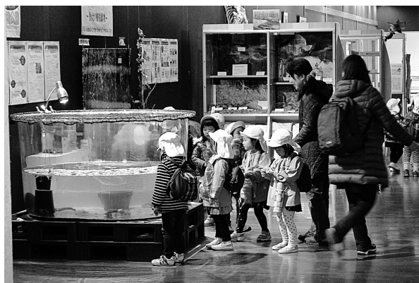
図4. 仙台市八木山動物公園ビジターセンター内に設置したメダカ飼育水槽の様子。詳細な仕様は、棟方ら(2013)を参照。

また本事業では、仙台市八木山動物公園内ビジターセンターにおいても、本メダカ個体群の飼育を継続している（図4）。こちらの飼育水槽では、メダカの増殖というよりは、本メダカ個体群のように、震災時の津波によって地域の個体群が絶滅した生物がいること、またその再建を目指していることを知ってもらうための啓蒙水槽としての役割を担っている。なお、後述するように、八木山動物公園においては2014年に本水槽に加えてメダカの増殖と啓蒙を視野に入れた野外のビオトープを設置する計画となっている（図7）。