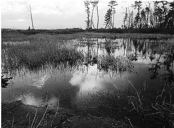
図5. 名取川河口域北岸にみられた湿地(2013年10月27日撮影)。この湿地は、その後、水位が低下し、乾燥化した。

消失してしまったものや、これから埋め立てられる予定の場所が多く、メダカの放流には向かないと考えられる。以上のことから、現時点で井土地区周辺の自然水域の中で本メダカ個体群の放流候補となるのは、②の2つの池ということになる。