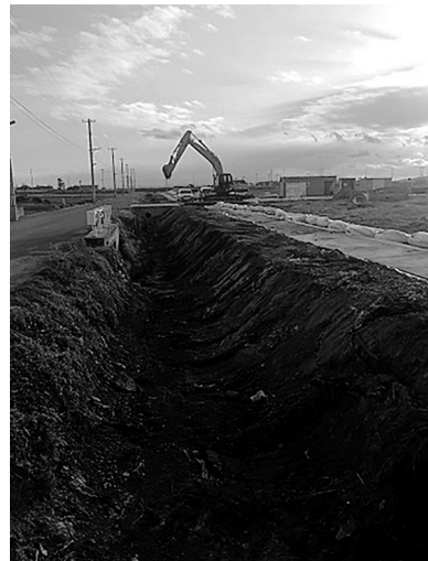
図6. 井土地区のメダカ生息域の圃場整備の様子(2013年12月12日撮影)。

一方、もともとメダカが生息していた井土地区の田圃の周辺では、除塩作業に引き続き、現在は新たにコンクリート製のU字溝を敷設する作業が行われている(図6)。このため、少なくともこの工事が終了し、通水が再開されるまで、メダカを放流することはできない。また、通水が再開された後も、新たな水路はコンクリートで構築され、メダカの繁殖に必要とされる低い流速(15 cm/秒)(小林ら, 2012)や産卵基質となる種々の水生植物が再生するか否かは、予断を許さない。しかし、むしろ今後の震災復興ではメダカの野生個体群の再建という目標を共有し、用水路の管理者らとともにコンクリートの水路内に一部、メダカの生育や繁殖に必要と考えられる整流装置や水生植物の自生のための基質を設置するといった取り組みを推進することが望まれる。