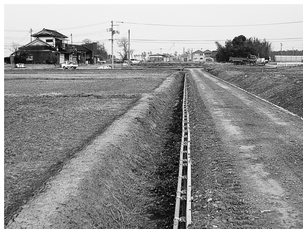
図2. 震災から二年が経過した井土地区の田圃および用水路の様子(2013年3月7日撮影)。通水が停止され、用水路は乾燥化している。