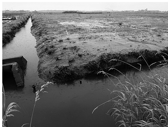
図1. 震災後(2012年6月19日撮影)の名取川河口域北岸井土地区の田圃および用水路の様子。元の田圃であった部分は土砂で埋まり、畦を超えて用水路内に砂泥が堆積している。この時点では用水路の流量は震災前と同レベルであった。

一方、震災後の2012年6月19日に行った調査ではメダカは全く採集されなかった。メダカ以外の魚類は、フナ類、ヌマチチブ（ Tridentiger obscurus ）、ボラ（いずれも稚魚）が、また魚類以外の動物としてはアメリカザリガニ、スジエビが採集された。また、2012年10月15日の調査では、同じくメダカは全く採集されなかった。メダカ以外の魚類は、フナ類、ウグ