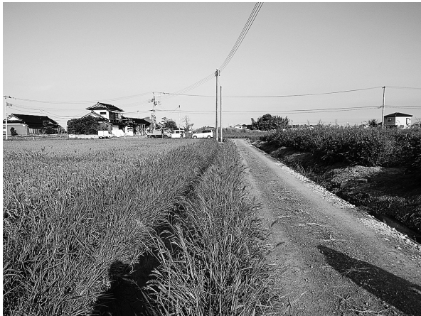
図3. 井土地区の田圃および用水路の様子(2013年8月29日撮影)。通水が再開され、稲の作付けが行われている。この際、用水路ではアメリカザリガニの若齢個体が主に見られた。

イ ( Tribolodon hakonensis ), ハゼ科の一種, ボラ (いずれも稚魚) が確認された。また、魚類以外の動物は、アメリカザリガニ, スジエビ, トンボ類の幼虫が採集された。