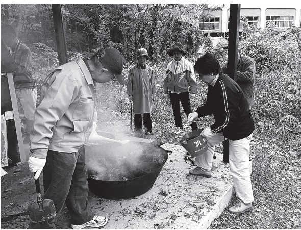
図5. 炭焼き実習の様子