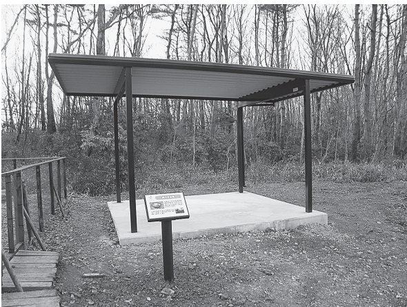
図2. 完成直後の「炭やき広場」

化器を始め、物置小屋・火バサミ・ジョウロ・バケツなど、炭焼きに必要な物品を購入した。