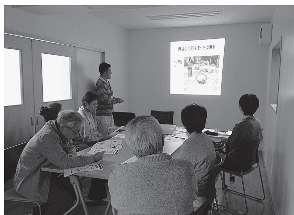
図3. 公開講座の基礎講義の様子